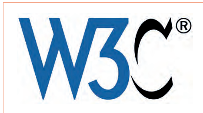
Figura 1.3 - Il logo del W3C.

Decisivo in questo senso fu l'intervento del WaSP (Web Standard Project), un gruppo di web designer e sviluppatori creato nel 1998 (e sciolto solo pochi anni fa) che si prodigò (anche con forza) per diffondere e incoraggiare le raccomandazioni del consorzio. Sebbene Microsoft