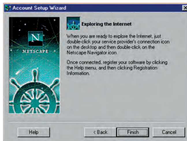
Figura 1.2 – Uno screenshot di Navigator, un browser molto popolare negli anni '90.

Che cos’ha a che vedere questa guerra tra browser con il Web Design? Molto, in verità. Explorer e Navigator erano